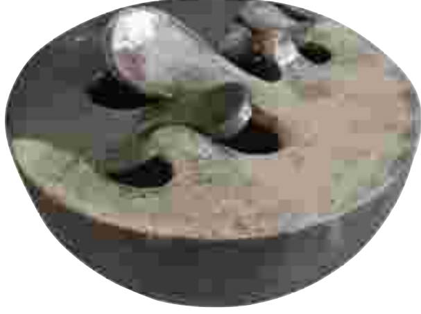
Sergideki öğrencilerin çalışmalarından bir örnek