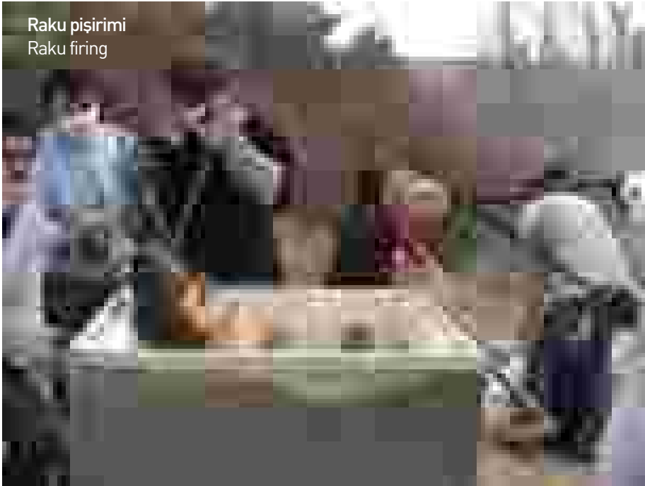
Raku pişirimi Raku firing