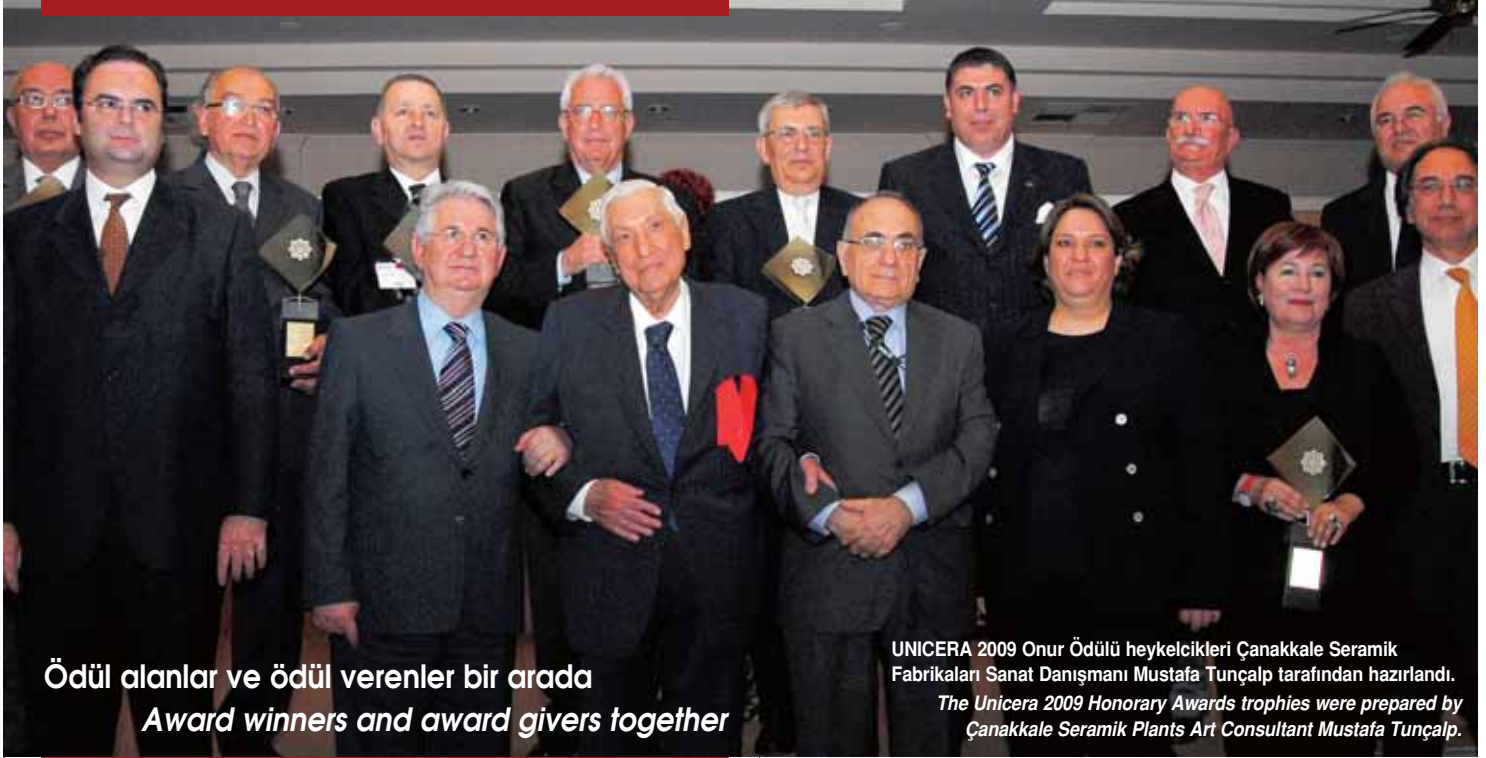
Ödül alanlar ve ödül verenler bir arada Award winners and award givers together