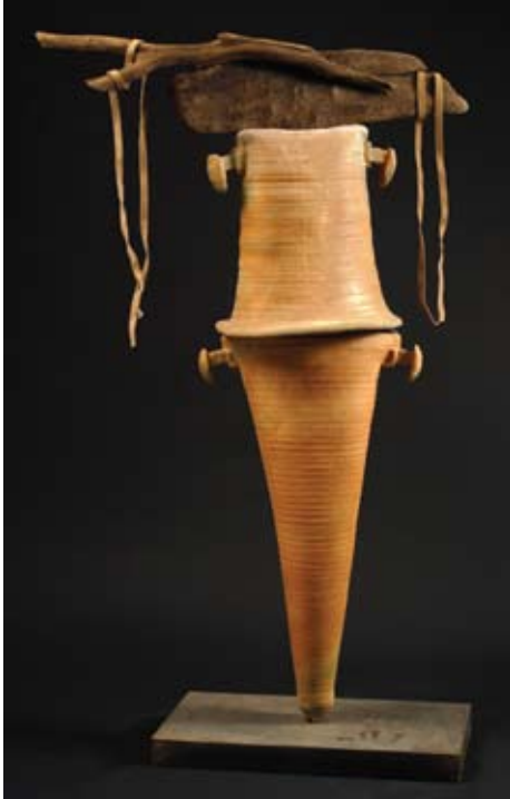
Çaput (Yüksek isi ve redüksiyonda fırınlanmış, mix media, stoneware) (High temperature and reduction fired, mixed media, stoneware) (yükseklik / height: 140 cm, en / width: 48 cm)

Especially my graduation show was held at