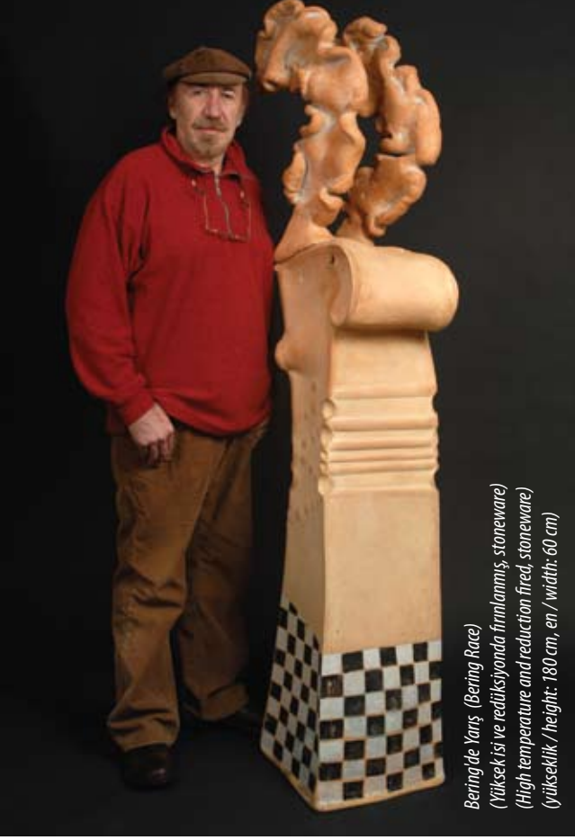
Bering'de Yarış (Bering Race) (Yüksek ısı ve redüksiyonda firınlanmış, stoneware) (High temperature and reduction fired, stoneware) (Yükseklik / height: 180 cm, en / width: 60 cm)

“Türk seramik endüstrisinde çok önemli adımlar atıldığına ve bunun seramik eğitime büyük katkısı olduğuna inanıyorum.”