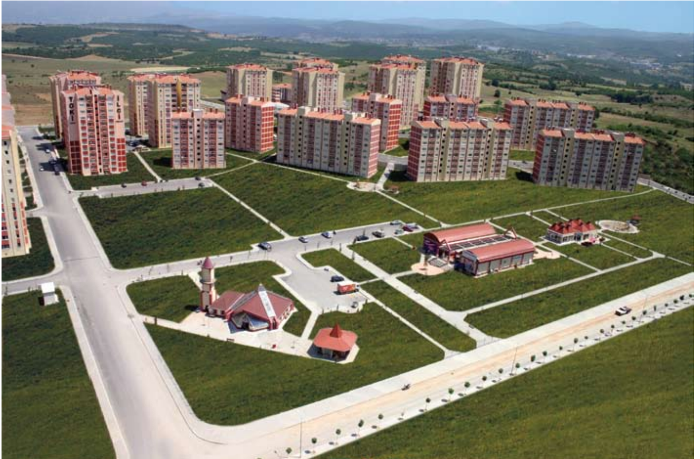
Bursa Merkez-Nilüfer Toplu Konut Uygulaması / Bursa Central-Nilüfer Mass Housing Project

As TOKİ, we try to provide opportunities for our low income group and poor citizens who have no saving power and ability to pay cash