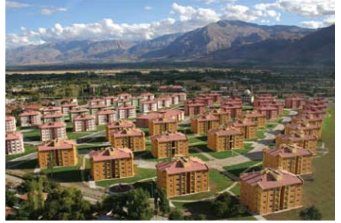
Erzincan Merkez Gecekondu Dönüşüm Uygulaması / Erzincan Central Slum Transformation Project

“The point of intersection of population movements, rapid urbanization, decrease in people in households and inadequacies in production of urban lots is the starting point of the housing problem”