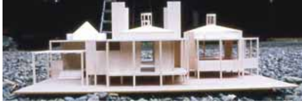
Doktor Umezu Evi, Tokyo, 1991 Doctor Umezu's House, Tokyo, 1991

“Gerektiği yerde gereç ile düşüneceksiniz. Bütüncül bakışın içinde, teknolojiyle bir şiiri yazacaksınız”