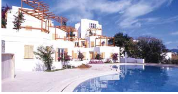
Antik Tiyatro Oteli, Bodrum, 1988 Antique Theatre Hotel, Bodrum, 1988

anlayabilmesi, kendi dinini anlayabilmesi için bir şeyler söyledim. Işık yönlendirmesi, sabah mihraptan ışık gelir, bugüne kadar hiç yapılmamıştır. Yani siz sabah namazında güneşin doğuşunu, ilk ışıklarını duyumsarsınız. Belli bir yerden ışık gelir, öğlen ikindi namazını bilirsiniz. Binanın içindeki ışık saati söyler. Onu tabi yaşayanlara sormak lazım, acaba algılayabiliyorlar mı?