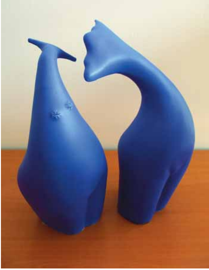
Özyay Korkmazgil, 2003