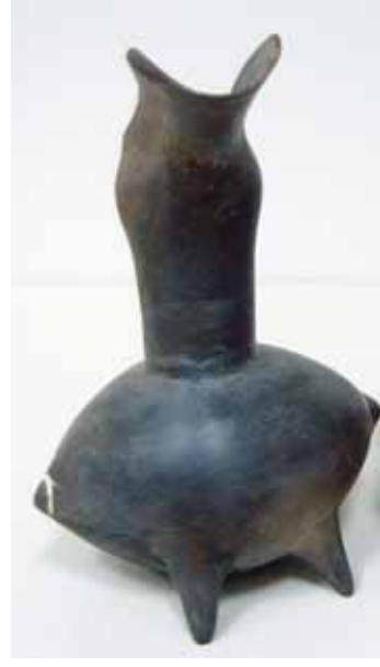
Özlem Başkan, 2001