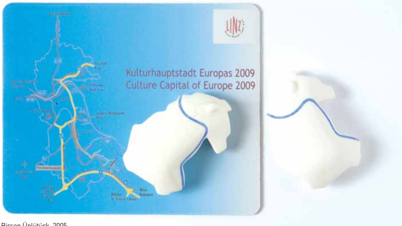
Birsen Ünlütürk, 2005