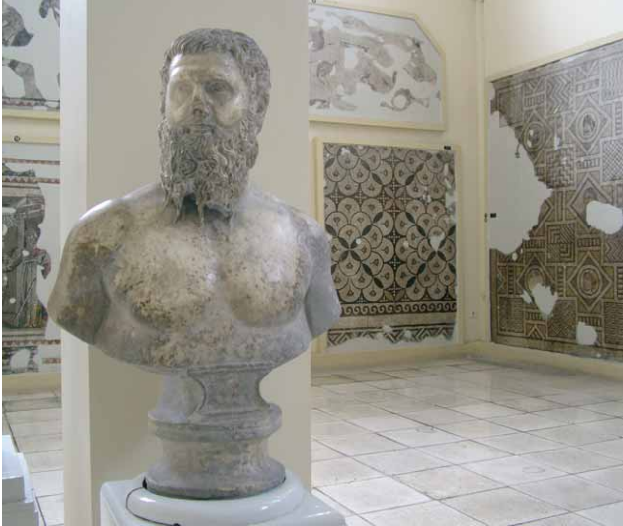
Roma İmparatoru Pertinaks / Roman Emperor Pertinax

Hatay Museum with its rich mosaic collection