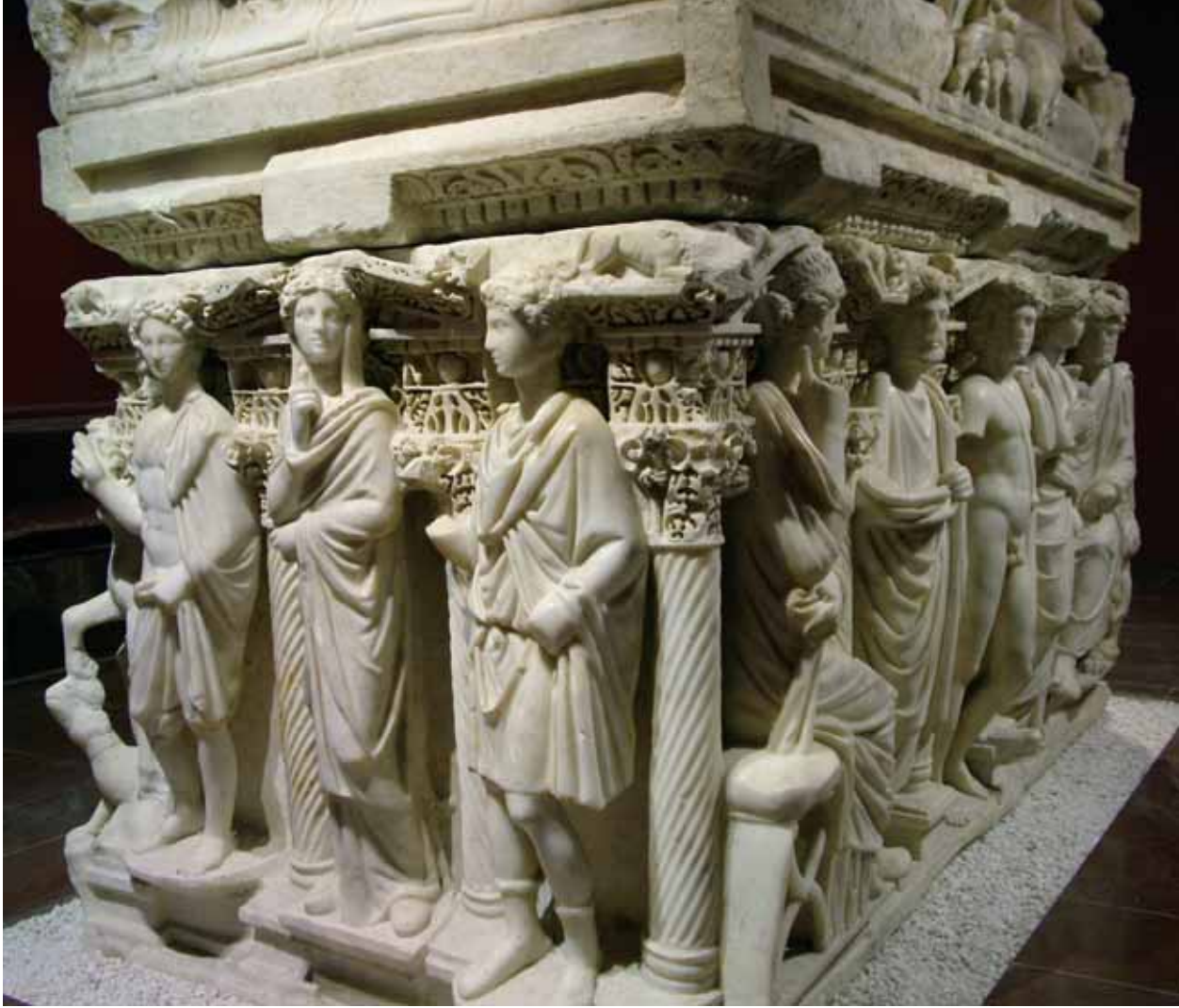
Sidemera Lahti / Sidemera Tomb

arası Açına Höyüğü'nde hafriyat yapmıştır. Princeton Üniversitesi de Antakya civarında araştırma kazıları yaparak müzenin esas zenginliğini temin edecek mozaikleri çıkarmışlardır.