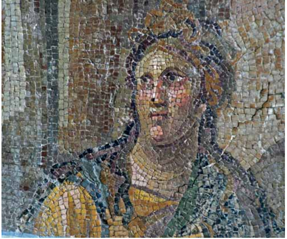
İsis Mozaïği Isis mosaic

M.Ö. 4 binden itibaren zamanımıza kadar her dönemin çeşitli kültür ve tarihi vesikalarını bünyesinde toplayan Hatay'da ilk kez 1932 yılında bilimsel kazılara başlanmıştır. Çalışmaların henüz ilk yıllarında bulunan çok sayıda eserden dolayı, Fransız idaresinde bulunan Hatay'da görevli, Antikiteker Müfettişi M.Prost'un isteğiyle Antakya'da bir müze kurulmasına karar verilir. Modern müzecilik anlayışına uygun hazırlanan plan 1934'de uygulanmaya başlanmıştır. 1939 yılında inşaatı tamamlanan müzede üç ayrı bilimsel kazıda bulunan eserler yer almaktadır. Chicago Oriental Institute 1933-38 arası Amik Ovası'nda Cüdeyde, Dehep, Çatalhöyük ve Tainat'ta çalışmalar sürmüştür. British Museum adına Sir Leonard Wolley 1936'da Samandağı'nın El-Mina Mevkii'nde, 1937-48