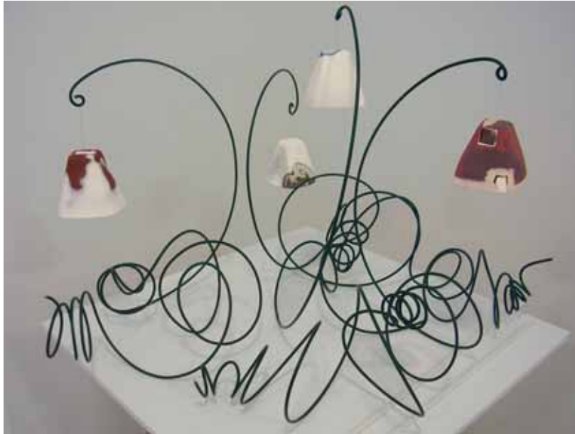
Feyza Özgündoğdu, Çanlar - Bells