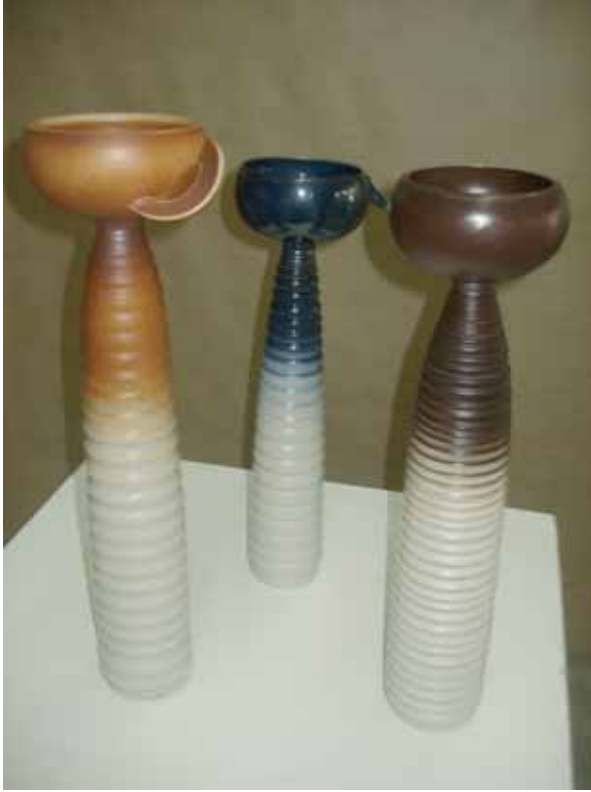
2. Mansiyon - 2. Honorable Taşkın Okay

Açılış ve ödül töreni 2 Mayıs 2006 tarihinde İzmir Resim ve Heykel Müzesi'nde yapılacak olan '9. Altın Testi Seramik Yarışması' Sergisi, 14 Mayıs'a kadar aynı mekanda izlenebilir.