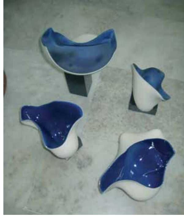
1. Mansiyon - 1. Honorable Mention Ömer Görkem