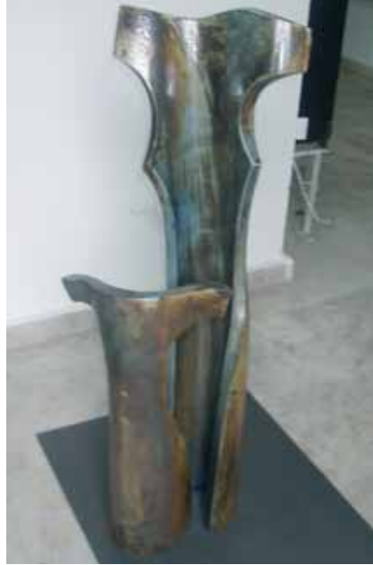
3. Ödül – 3.Prize Hakan Yılmaz

İzmir Rotary Kulübü'nün sanatsal seramiği tanıtıcı, sanatsal gücü geliştirici ve sanatçıları teşvik edici düşünceyi temel amaç olarak bu yıl 9.'sunu düzenlediği seramik yarışmasının seçici kurulu değerlendirmesi yapıldı.