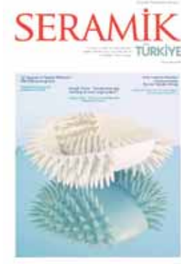
Kapak - Cover: Güngör Güner