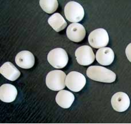
Resim-4 Kurutma Picture-4 Drying