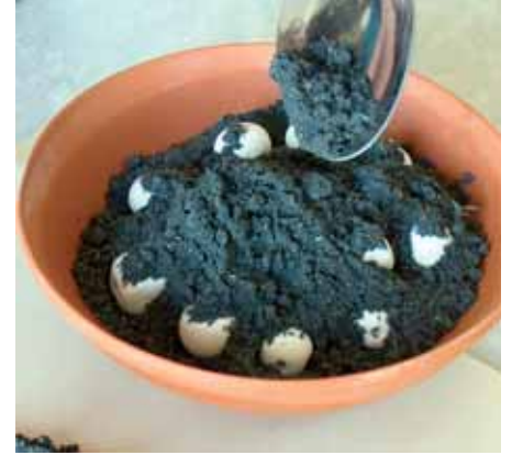
Resim-6 Boncukların kuru sır harmanına yerleştirilmesi Picture-6 Placement of beads on the dry glaze mix