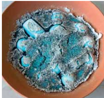
Resim-8 Pişirim sonrası kuru sır harmanı ve boncuklar Picture-8 The dry glaze mix and beads after firing