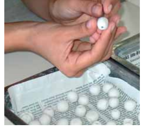
Resim-3 Boncukların kurutmadan önce delinmesi Picture-3 Piercing of beads before drying