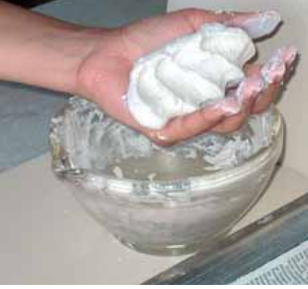
Resim-1 Şekillendirilmeye hazır kuvars hamuru Picture-1 Ready to be shaped quartz clay