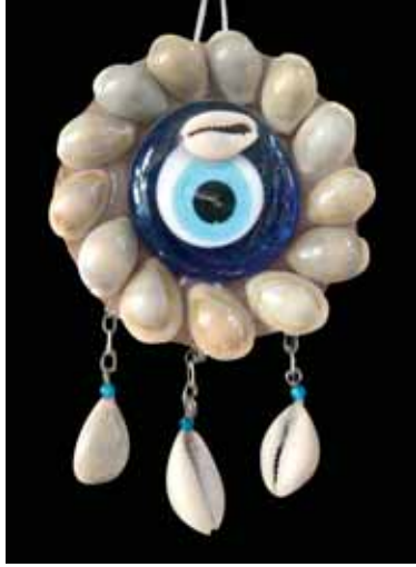
Resim-1 Dilgöz boncuğu Picture-1 Dilgöz bead