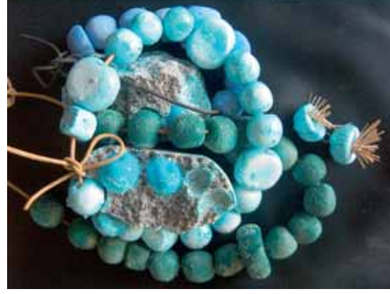
Resim-11 Boncuklar Picture-11 Beads