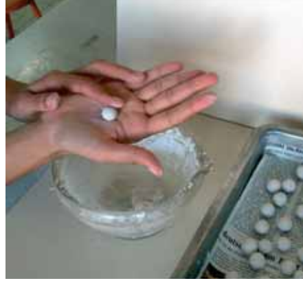
Resim-2 Şekillendirme Picture-2 Shaping