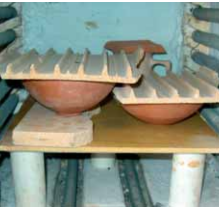
Resim-7 Üzeri Örtülü kapların fırına yerleştirilmesi Picture-7 Placement of covered containers into the kiln