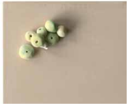
Resim 5 Farklı harmanlardan elde edilen boncuklar Picture 5 Beads obtained from various mixes

ries, raw materials like marble, calcite, quartz and calcine soda available at the laboratory and as colorant, copper chloride, copper carbonate, copper slag and cobalt carbonate were used. Finely pulverized quartz and the organic origin bonder produced by a firm were used in preparing the bead paste.