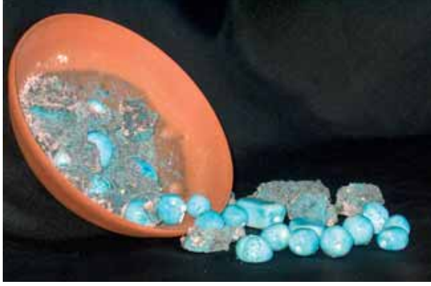
Resim-10 Boncukların kuru sır harmanından çıkarılması Picture-10 Removal of the beads from the dry glaze mix