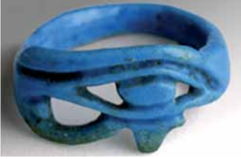
Resim-3 Mısır pastası,yüzük,i.ö. 1370-1320

Fırın soğuduktan sonra; kaplar ters çevrilip, içindeki kuru sır harmanı olarak adlandırdığımız kütle kırılıp, parçalanarak açılır. Ortaya