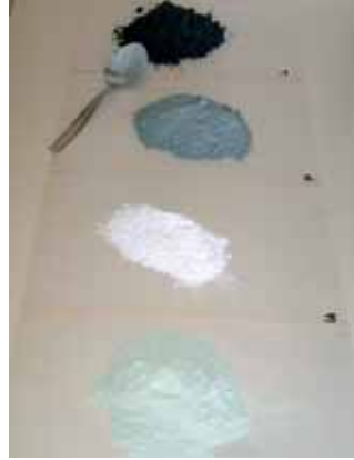
Resim-5 Farklı kuru sır harmanları Picture-5 Various dry glaze mixes