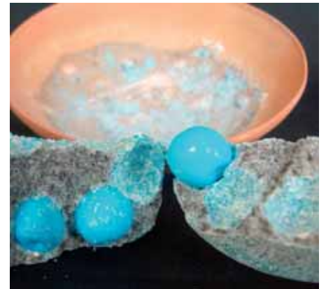
Resim-9 Ayrıntı Picture-9 Detail