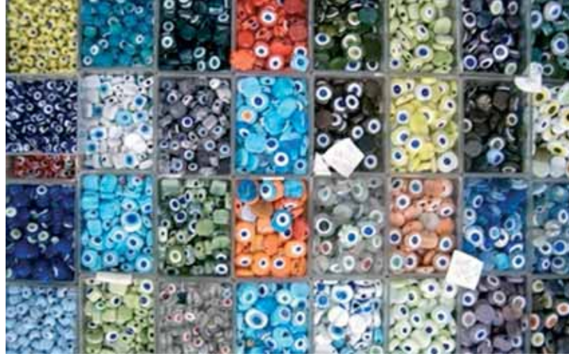
Resim-2 Cam boncuklar Picture-2 Glass beads

Turkoman societies, it is believed that the snake would die if his mouth is spit upon and this would make sure that one would be free from the effects of the evil eye any more.