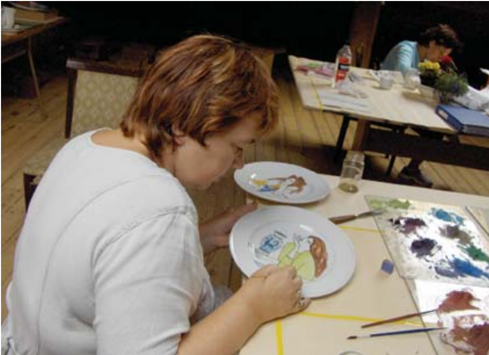
Porselen boyama / Porcelain dyeing