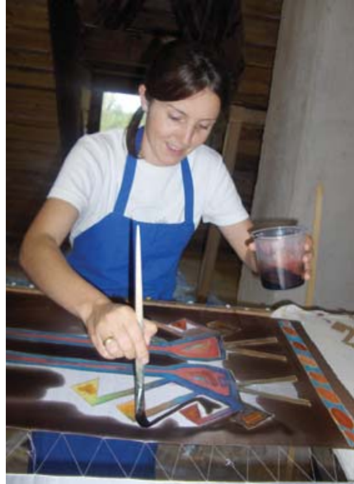
İpek boyama / Silk dyeing

The participants, alongside of their free activities, followed porcelain and silk dyeing workshops and held shows and made presentations at Latvia Art Academy at the end of the symposium as part of "Dialogue 2005" event.