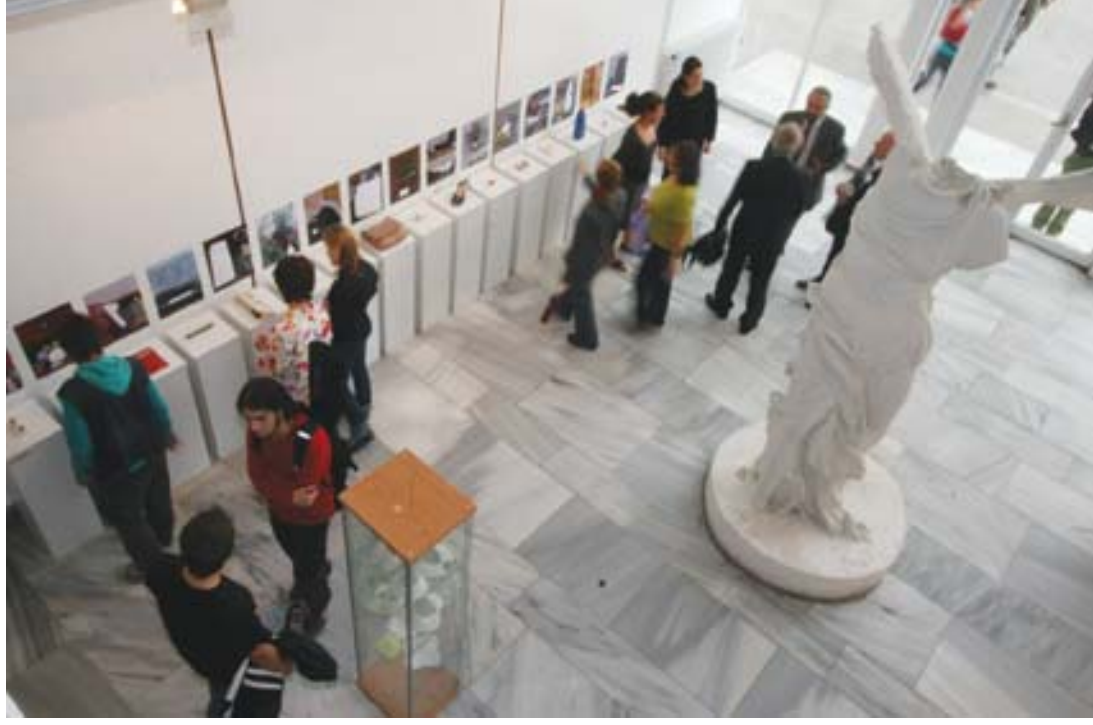
75th Year Student Show Ceramic and Glass Design Department Students Show

Mimar Sinan Güzel Sanatlar Üniversitesi Seramik ve Cam Tasarımı Bölümü'nün kuruluşunun 75. yılı nedeniyle düzenlenen etkinliklerden biri olan "75.Yıl Öğrenci Sergisi" üniversitenin Fındıklı'daki Güzel Sanatlar Fakültesi binasında açıldı.