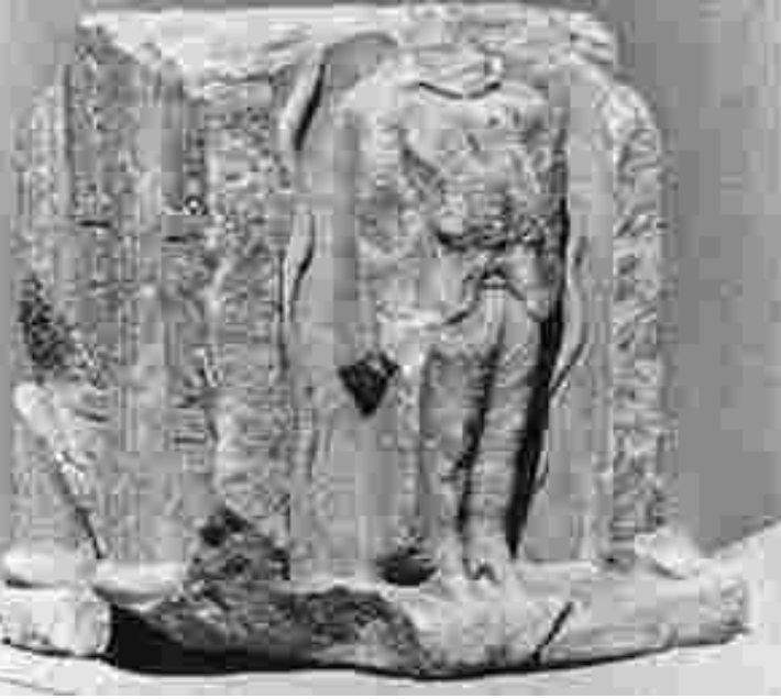
■ Lidyalıların ana tanrıçası Kuvava (Kibele) kabartması Relief of Lydian mother goddess Kuvava (Kybele)

here was gathered to be offered to the mother goddess. It is very interesting that such lioned offering sites are also found on Etruscan wall drawings. Herodotus (I, 94) says that the Etruscan who lived in Lydia migrated to Italy because of the great famine in the country. In respect of this historical issue which has caused major controversy, the depictions of the lioned offering site and the horsemen and pastoral figures in this wall drawing have major similarities with the archaeological findings in Lydia.