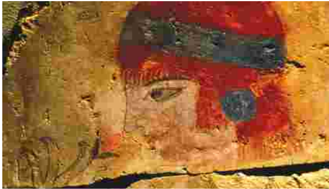
Lidya hazinesinden çeşitli eserler Various artifacts from Lydia Treasure

Tmolos (Bozdağ) Mountains were rich in both natural and also underground resources. Lydians obtained the stones they used in statues and also monuments from the marble quarries here. Also, beside the gold and silver deposits which made them world rich, there were arsenic used in painting of copper and antimony used in cosmetics and drugs on Lydian soil. Lydian blankets, embroidered pillows and carpets were known all over the antique world. It was believed that the Lydians discovered painting wool for the first time. The sulfur deposits, used in softening the wool and especially the thermal waters of Kurşunlu spas of today, rendered the Lydian products without rivals. Hypaipa, which was another Lydian settlement near Birgi on the southern skirts of Bozdağ mountains, was famous for the root dyes used in dyeing of fabric and wool.