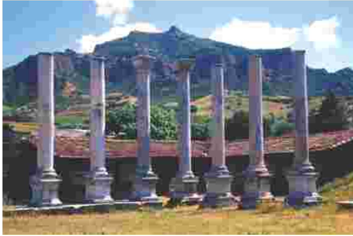
■ Lidyalıların başkenti Sardes Lydian capital Sardes

Pers hakimiyeti öncesine ait soyulmamış mezarların bulunması ya da özgün Lidya yerleşimlerine ait ören yerleri günışığına çıkarılabilirse bu ilginç Anadolu uygarlığına ait bilgilerimiz artacaktır. Lidya Devleti Anadolu'ya özgü bir uygarlığın temsilcisidir. Phrygce'ye benzeyen 26 harfli bir alfabeleri ile yazılmış yazıtları daha yeni anlaşılmaya başlamıştır. Kuvava, adını verdikleri Anadolu'nun Büyük Anası'na büyük saygı göstermişler, Artimu adını verdikleri Artemis'e Levs, Santas, Marvida ile Lametrus gibi yerel adlar taşıyan tanrı ve tanrıçalara da tapmışlardır. Günümüzün vazgeçilmez para ekonomisi de onlara çok şey borçludur. Lidya'luların kutsal nehri Gediz'in taşıdığı alüvyonlar, efsaneler dağı Tmolos'dan ve ele geçirilen akropollerinden inen topraklar bugün bu uygarlığın altın günlerini örtmüş durumda. Lidya tabakaları günümüz seviyesinden 10-15 m aşağıda yer almaktadır. 2000'li yıllarda bu ilginç uygarlık hakkında daha fazla bilgiler elde edilecektir.