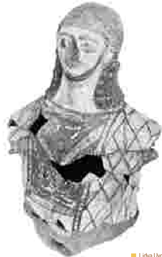
■ Lidya Uygarlığı'na ait iki değişik seramik eser Two ceramic works from Lydian civilization

Herodot'a göre, Kroisos "Batı Anadolu'daki tüm Grek kentlerine egemen oldu ve bunları kendine vergi ödemeye zorunlu kıldı..." Kroisos'un bu başarısında Grek devletleri arasındaki çekişmelerin önemli rolü olmuştur. M.Ö. 5. yüzyılın ünlü oyun yazarı Aiskhylos'un deyimiyle Kroisos zamanında başkentleri "Altın Sardes" ya da "Altın yatağı Sardes" denecek ölçüde zenginliğinin ve kültürel gelişiminin doruğuna ulaştı. Başkent göz kamaştırıcı bu görkemli zenginliği; dönemin yaşam kültürü içinde büyük bir merak konusu ve bir Lidya hayranlığının oluşmasına neden olmuştur. Gerçekten de klasik çağda Lidya ve Sardes denince şair Anakreon'un dizelerinde anlatıldığı gibi, lüks bir yaşam akla gelmekteydi.