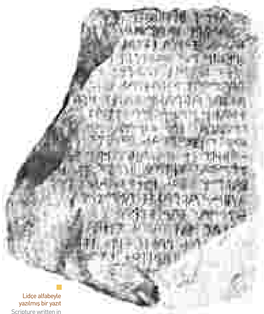
■ Lidçe alfabeyle yazılmış bir yazıt Scripture written in Lydian alphabet