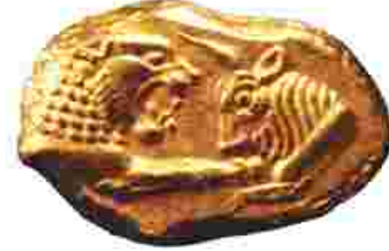
■ Lidya altın stateri. Tarihte en eski sikkelerden Lydian gold stater. One of the oldest coin specimens in history

The source of Kroisos's wealth everyone talked of was the taxes taken as tribute from regions, business income and the natural resources of the country. However, as stated by the famed geographer, Strabon of Amasya, and Greek orator and philosopher Dion Khrystostomos, the most important one among these sources of income was the gold mines. According to antique sources; beside Paktolos, Lydians extracted gold in Magnesia-ad Sipylum (Manisa), between Bergama and Dikili, in Dardanelles, in the mine quarries near Abydos (Cape Nara) in Astyra, as well. However, Kroisos's much talked about wealth has been a factor leading to his tragic demise. The attractiveness of rich Lydia had directed the Persians who rapidly gained power in Iran in the East. In mid-VI Century B.C., seeing the Persian danger appearing in the eastern border, has started a campaign towards Capodicia in the spring of 547 B.C., crossing Kızılırmak. The first Lydian-Persian war was concluded by the retreat of Kroisos who obeyed the classical war traditions of the antique era, upon