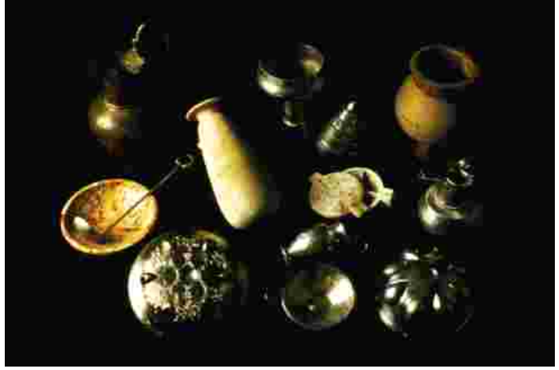
Lidya hazinesinden çeşitli eserler Various artifacts from Lydia Treasure

The Lydians which made a great contribution to the world of economy of humanity by inventing coins are recognized also as the inventors of first public parks and bordellos. The fact that recreation and accommodation sites were advanced in Sardes, which was a meeting point of businessmen and passengers from various nations, shows that the Lydians knew how to make money with their business sense. Therefore, we can say that the first steps of the tourism sector were taken in Western Anatolia. Sardes's having been founded at a point where the trade roads coming from the east and the west intersect and the wealth brought about by gold mines are other important elements leading to such progress.