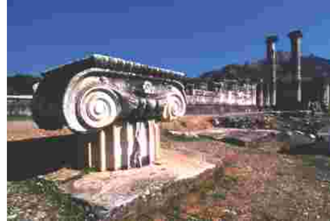
■ Sardes Artemis Tapınağı Sardes Artemis Temple