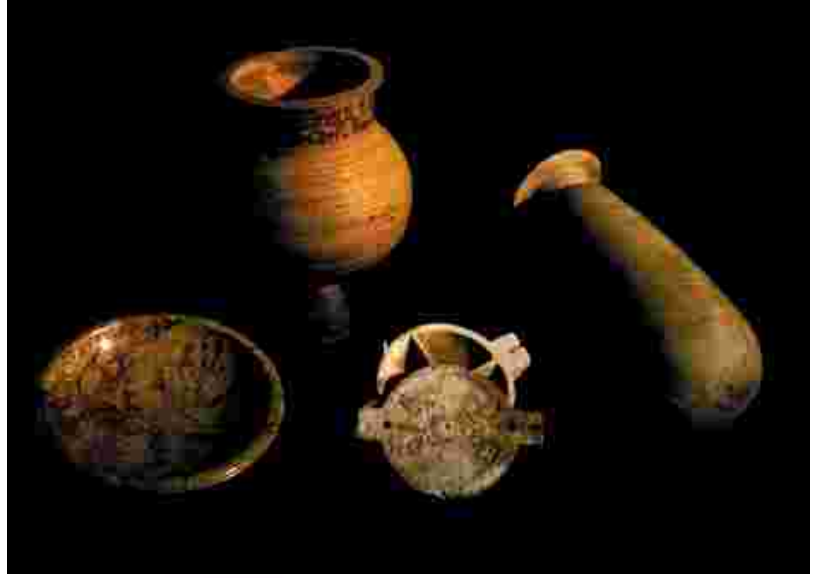
■ Lidya hazinesi Lydian Treasure